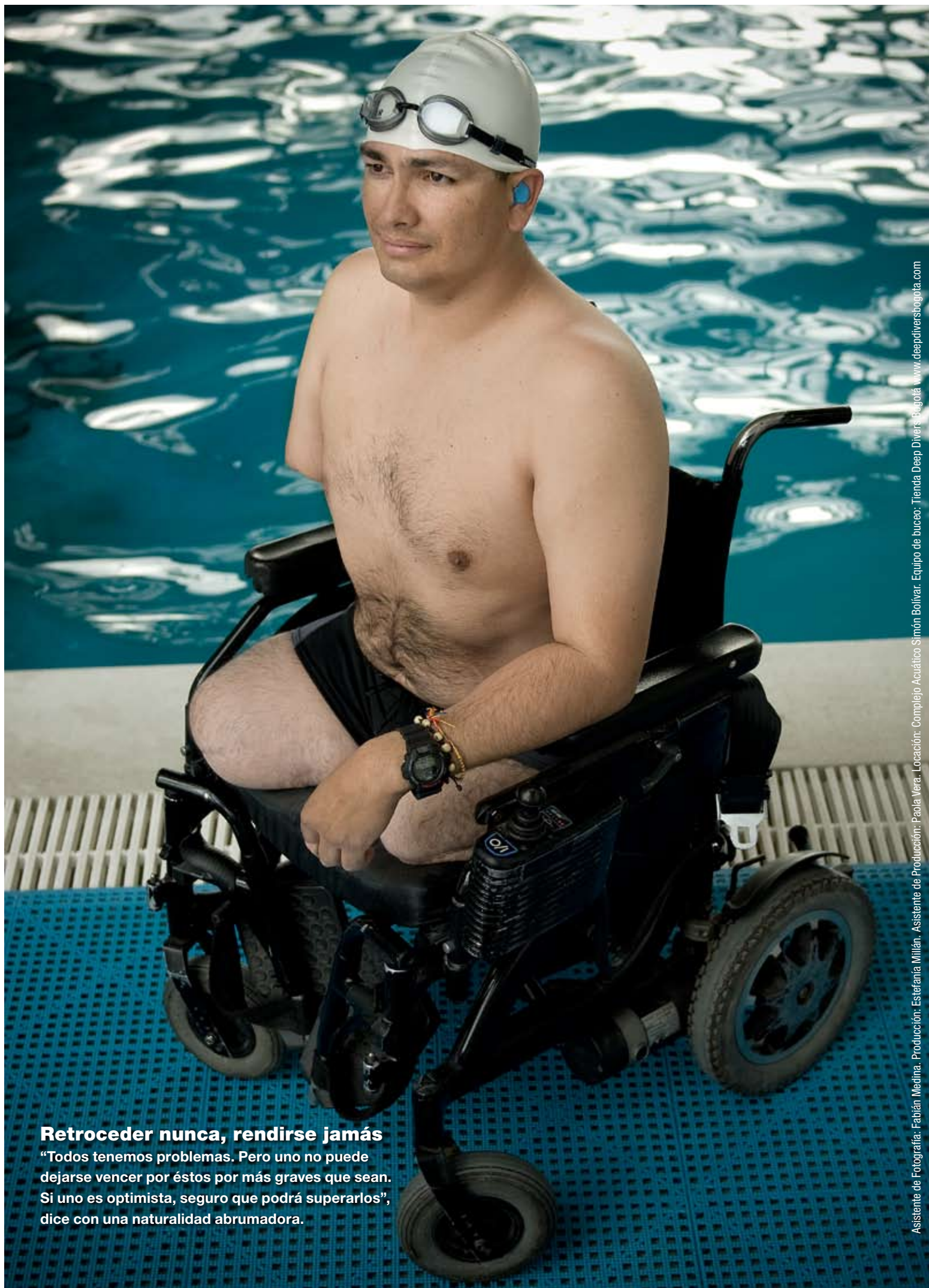
Asistente de Fotografía: Fabián Medina. Producción: Estefanía Millán. Asistente de Producción: Paola Vera. Locación: Complejo Acuático Simón Bolívar. Equipo de buceo: Tienda Deep Diver Bogotá. www.deepdiversbogota.com